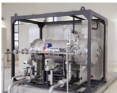
具有净水功能的臭氧发生器