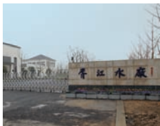
苏州市自来水公司胥江水厂